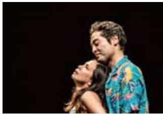
2016年1月『Summer House After Wedding』