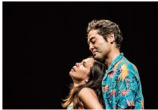
2016年1月『Summer House After Wedding』