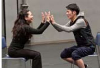
2016年12月 森下スタジオでのワークショップ