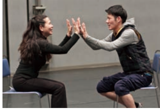
2016年12月 森下スタジオでのワークショップ